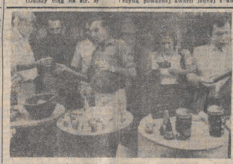
(Dalszy ciąg na str. 2)

Wykopany w Siemichowicach hełm poddany zostanie dokładnym badaniom naukowym. Być może ich wyniki odsłonią jeszcze jedną tajemnicę z bogatej historii ziemi sieradzkiej. (Lek.)