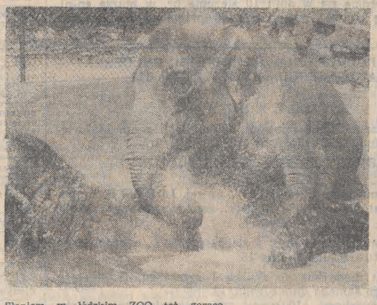
Sioniom w łódzkim ZOO też gorąco.

Dawniej przy BSO „Balaton” był czynny również „Bar Węgierski”. Później, gdy zabrakło surowców do przyrządzania pikantnych potraw kuchni węgierskiej, został on „przebrzmowiony” na wina i piwa. Sprzedaje się tu bowiem wyłącznie piwo w butelkach. A ponieważ nie ma tu już wina, nie wiadomo, kiedy bar ten jest otwierany. Czy nie warto zastanowić się nad wzbogaceniem indolentnego mini-baru „Balatonu” o potrawę jednodaniową, takimi np. dysponującymi lokalnie różną? Wówczas nie byłby on uzależniony tylko od dostaw wina. (j. kr.)