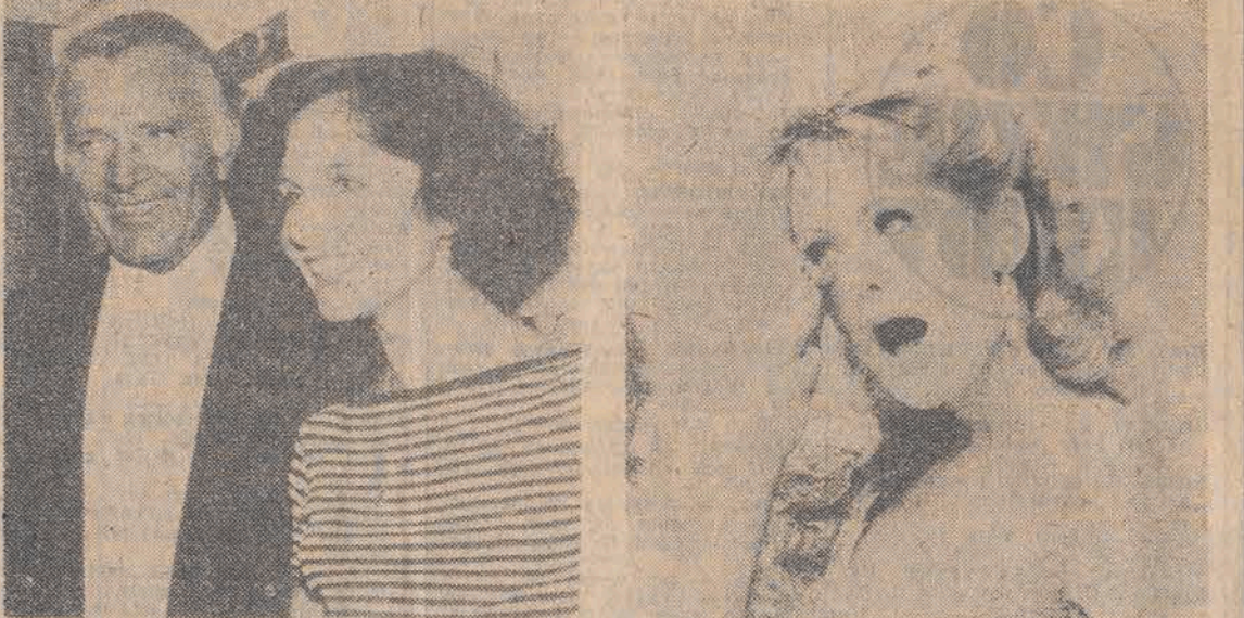
Znani – nie znani w nieoczekiwanych ujęciach fotoreporterów. Czekamy na Wasze listy z nazwiskami. Wśród czytelników, którzy nadesłali prawdziwe odpowiedzi rozlosujemy nagrody książkowe.

15.30 Reforma po starcie 17.30 Kino „Dwórki” – „Rozrywka o królów”. 19.00 Wiadomości (L). 19.30 Dziennik. 20.00 Telewizja Kraków na antenie „Dwórki”. Słowa na powitanie. 20.10 Wały Jagiellońskie – wczoraj 20.25 „Dymaki 82” – reportaż. 20.55 „Włam”. 21.10 Spowiedź Giedzia – reportaż. 21.30 O potrzebie pracy i kilku warunkach. 21.45 „Wały Jagiellońskie” – dziś. 22.15 Zakończenie programu.