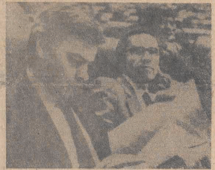
Felipe Gonzalez - nowy premier Hiszpanii.

23 marca 1980 r. - 77. Posłowie 1850 posiedzeń komisji i podkomisji sejmowych uchwalono ponad 120 zapytań.