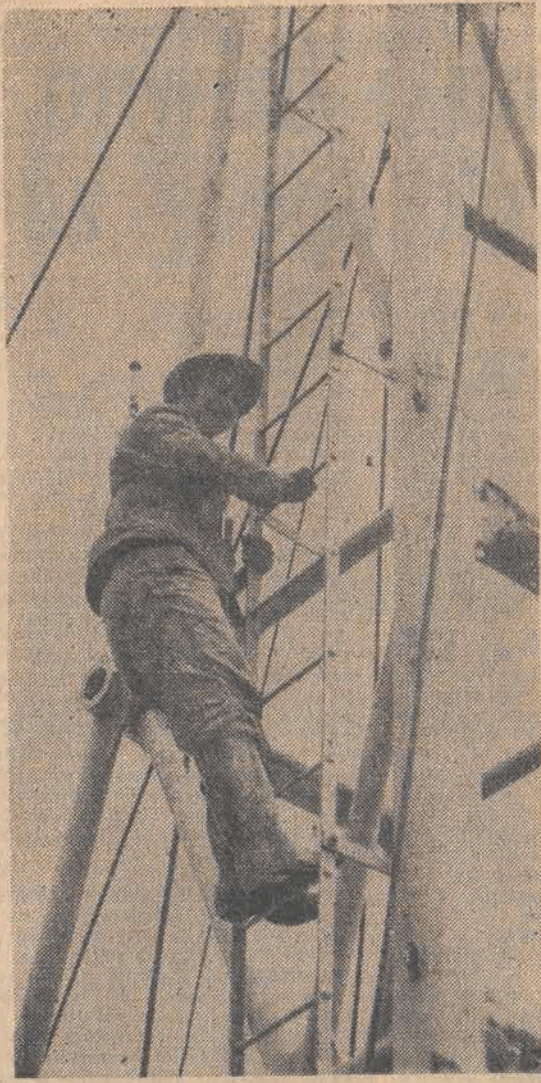
stanąć bardzo ciężkie budynki elektrowni. Wykorzystaliśmy do tego celu presometr Menarda, którym określono parametry wytrzymałości do 50 m.