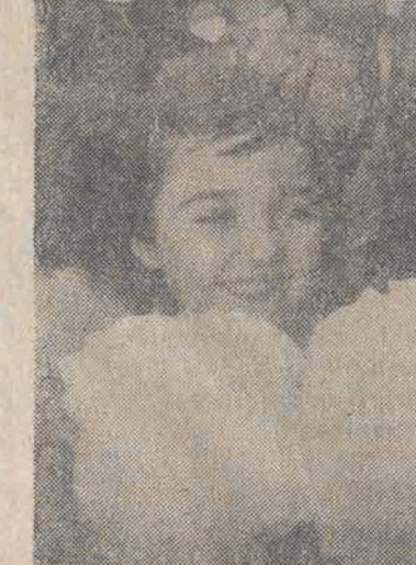
Kolejka po cukrową wate „szła” niesłychanie szybko, a ile radości, kiedy już się ma takiego łoda!