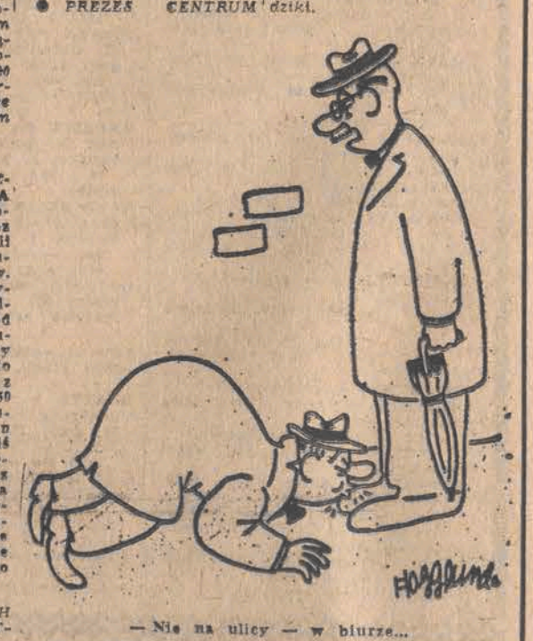
— Nie na ulicy — w biurze...