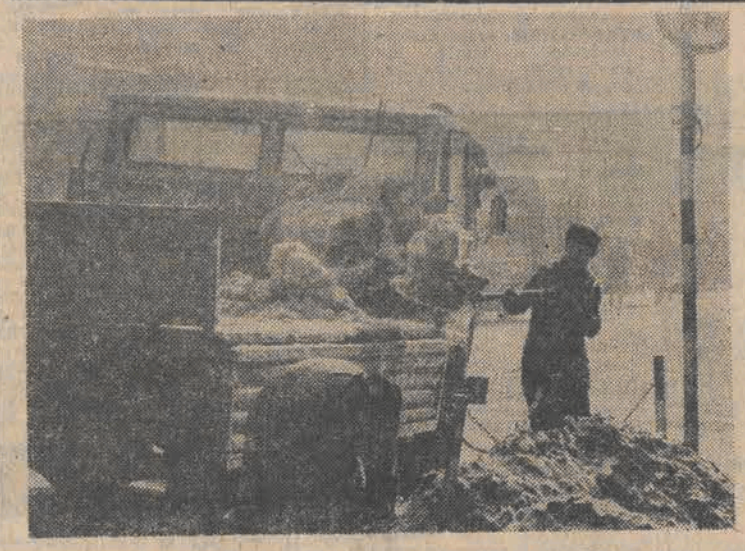
Brygady MPO nie miały dotychczas powodów by narzekać na zimę. Teraz trzeba jednak pracować przy usuwaniu śniegu z ulic.

Płócarka cieszy się ogromnym powodzeniem na osiedlu i jest bardzo przeładowana. Dobrze by zatem było aby podobnych filii przedszkolnych było w mieście więcej.