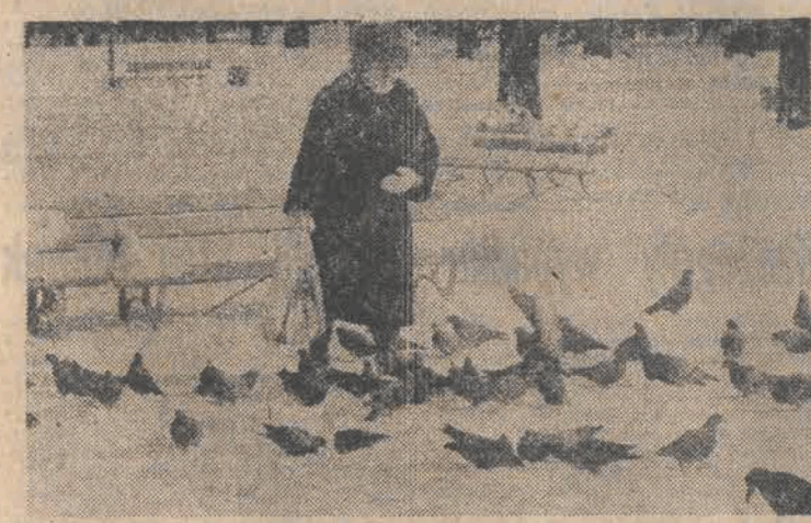
Śnieg, mróz. Ciepłe czasy jakże dla miejskiego utwata, które czeka na okrychu z naszych stołów.