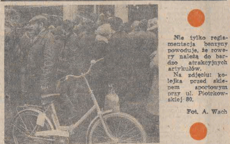
Na zdjęciu: kolejką przed sklepem sportowym przy ul. Piotrkowskiej 80.