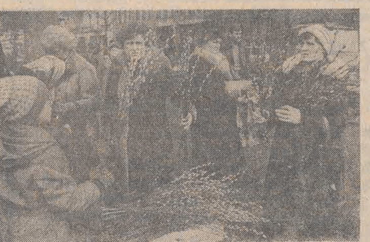
Bazie na ulicach Łodzi zdają się świadczyć, że wiosna już blisko.