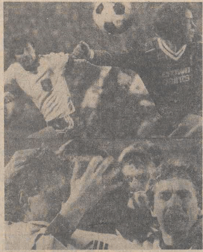
UPA W 70%