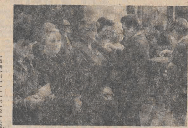
N/z: moment dekoracji