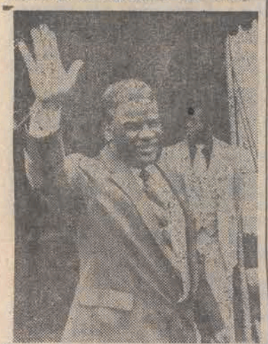
13 bm. pierwszy w historii Stów Zjednoczonych Murzyn Harold Washington wybrany został na stanowisko burmistrza w Chicago.

Tego samego dnia w godzinach wieczornych minister Olszowski wystąpił na konferencji prasowej składając oświadczenie dla prasy