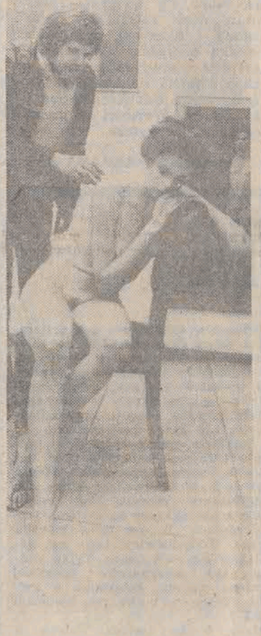
„Nowy realizm amerykański” to tytuł wystawy sztuki USA w Nowym Jorku...