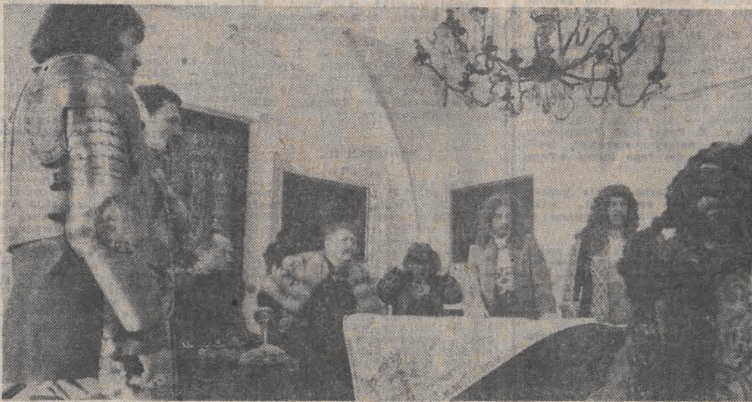
N/Z: na planie filmowym „Na odsiecz Wiedniowi — 1683”.