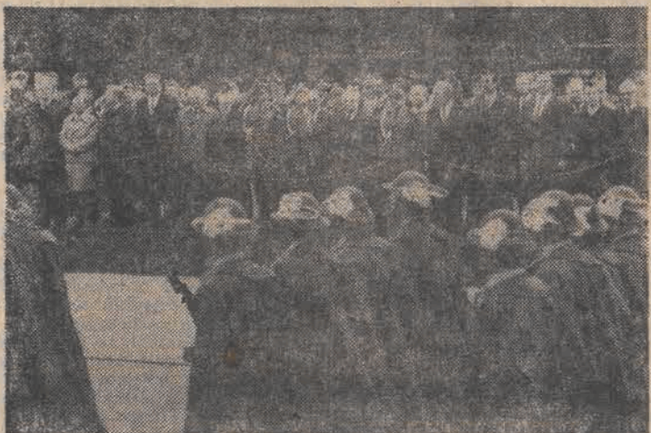
Uroczystość na placu Zwycięstwa.