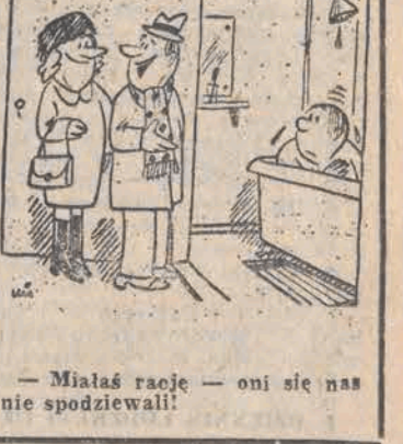
— Miałas rację — oni się nas nie spodziewali!

Taka sobie myśl: Nie martw się w tym średnim — wyrośniesz z tego.