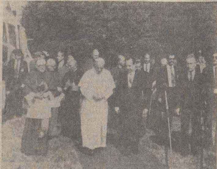
Powitanie we Wrocławiu.