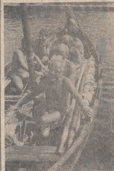
6 bm 12-osobowa załoga szwedzkiej archeologii na łodzi wiosłowo-żaglowej dawnych wikingów opuściła Zalew Zejrzyński w kierunku dalszej fregaty w Górze Włosty. Stąd przez Rucę Przędę i Dnieśń wypływa na zaimar dotrzeć nad Morze Czarne potwierdzając przynależność do w średniowieczu wikingów. Oto ona: 22 m długości 3,5 m szerokości 16 par wioseł.