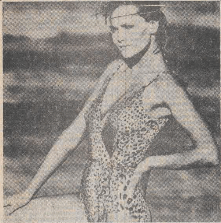
Na takiej modelce nawet mniej oryginalny kostium wyglądałby efektownie!