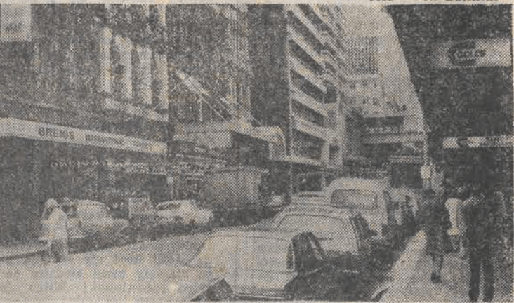
Na jednej z zatłoczonych ulic w centrum Sydney (Australii).