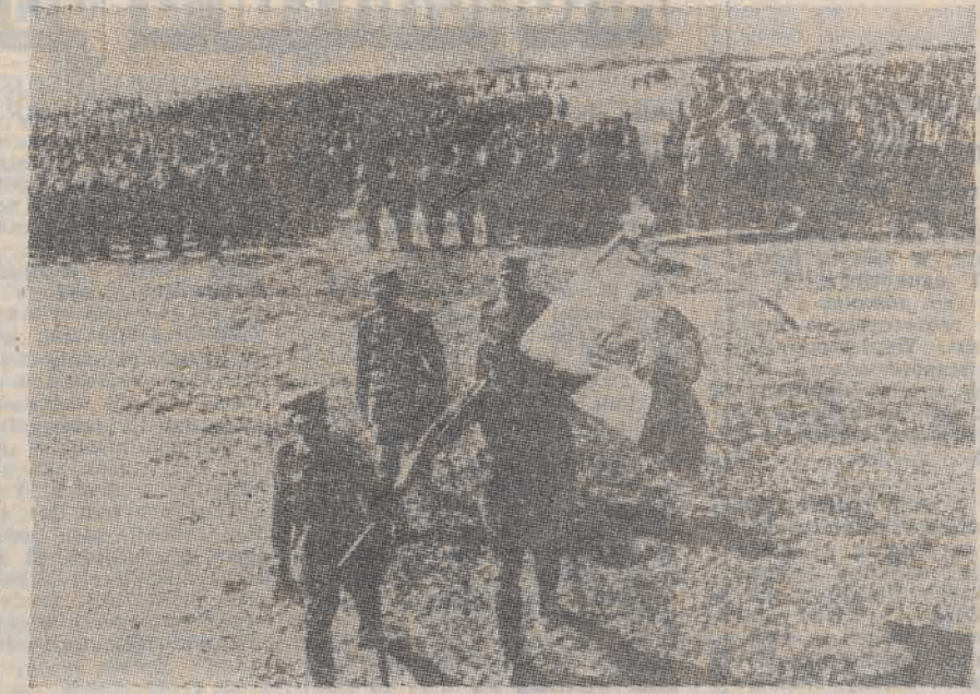
Przystąpienie 1 DP im. T. Kościuszki do składania przysięgi 15 lipca 1943 r. w Sielcach nad Oką.

Inny dziennik angielski „Daily Mirror” z 20 lipca 1943 r. pisze: „Po wyjeździe armii Andersa, liczącej 90 tys. żołnierzy, do Iranu, gdzie wojsko to stoi dotąd bezczynnie, na terytorium ZSRR nie było żadnej polskiej formacji wojskowej. Toteż powstanie Polskiej Dywizji im. T. Kościuszki dało pole do snucia rozmaitych koncepcji i nie brakowało takich, co widzieli w tym raczej żrący gest, „symboliczny”. Z tym większym zainteresowaniem korespondenci zagraniczni przyjęli zaproszenie Wandy Wasilewskiej i płk Zygmunta Berlinga na przysięgę dywizji... 70 do 80 proc. żołnierzy posiadało broń automatyczną. Imponujące były działa przeciwpancerne, moździerze, ciężka artyleria, 44 czołgi i oddział lotników. Żołnierze dywizji mają 25-35 lat, wśród nich jest 6 proc. Żydów, 3 proc. Białorusinów i 2 proc. Ukraińców... Wielu z nich było w Czerwonej Armii lub armii Andersa, niektórzy zdezerterowali z armii niemieckiej, brali udział w partyzantce, a potem wstąpili do dywizji, która pod względem siły ognia jest siedmiokrotnie silniejsza od dywizji polskiej z 1939 roku”.