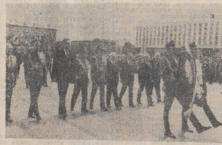
W Warszawie, w okazji Święta Odrodzenia, członkowie najwyższych władz państwowych, stronnicy politycznych i przedstawiciele władz ZBoWiD złożyli wieniec na Grobie Nieznanego Żołnierza. N/z: podczas uroczystości. CAF - Tadeusz Zagożdźliński

II wojny światowej b. żołnierzy ruchu oporu w kraju i za granicą, uczestników powstań śląskich i wielkopolskiego, dąbrowszczaków. (PAP)