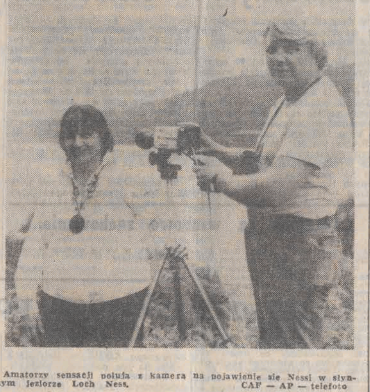
Amatorzy sensacji polują z kamerą na pojawienie się Nessi w słynnym jeziorze Loch Ness.