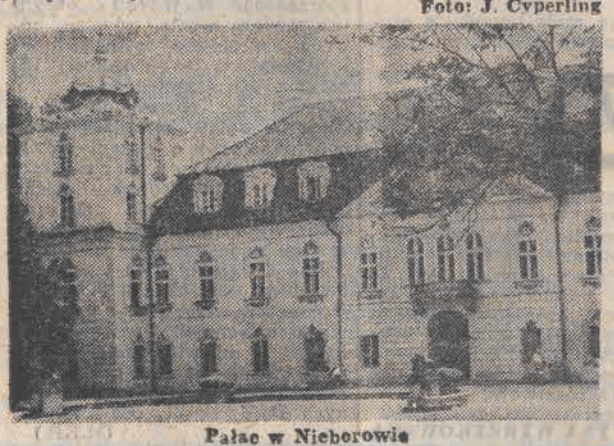
Pałac w Nieborowie