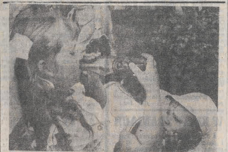
Z jednej butelki...