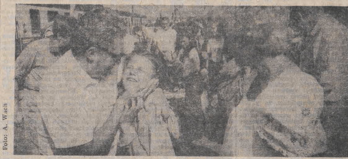
Wczoraj powróciła z wakacji spędzonych w okręgu Karl-Marx-Stadt w NRD ostatnia grupa łódzkiej młodzieży.

Rano dwa pociągi z Karl-Marx-Stadt i Zwickau przywiozły ponad tysiąc harcerzy, członków ZSMP, ZMW i ZSP oraz junaków OHP. Wszyscy z uznaniem i zadowoleniem oceniali pobyt za Odra, a także gościnność niemieckich przyjaciół. W ubiegłym tygodniu odwiedziła obozy pracy i wypoczynku w NRD delegacja władz politycznych i administracyjnych województwa łódzkiego.