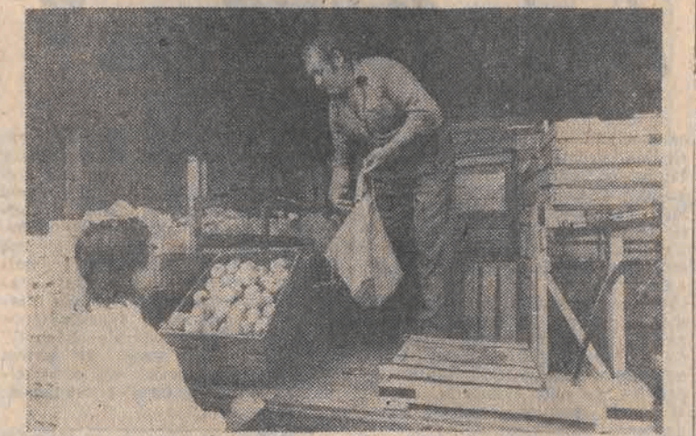
„AKCJA WITAMINA” Niezależny Samorządny Związek Zawodowy Pracowników Zakładów Przemysłu Cukierniczego 22 Lipca w Warszawie...

Wkładem naszej załogi w stabilizację życia kraju była i jest nieprzerwana praca. Osiągnęliśmy optymalną wydajność ludzi i maszyn, do czego przyczynił się m. in.