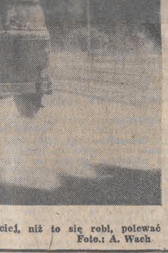
Podczas upałów warto byłoby częściej, niż to się robi, polewać łódzkie ulice.

Najstarszy miejski ogród działkowy w Łodzi im. M. Mireckiego obchodzi 50-lecie swego istnienia. Dziś ogród ma 240 działek uprawianych przez tyleż rodzin.