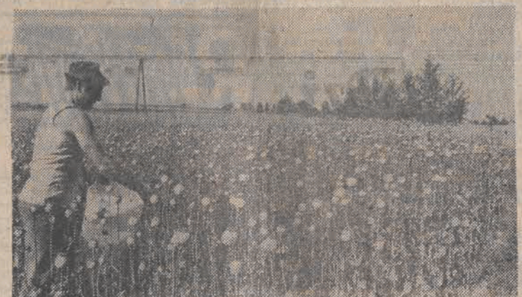
DOJRZEWA MAK, częściowo rozpoczęły się już jego zbiory. Aby zapobiec domowemu „przetworstwu” maku, Ministerstwo Rolnictwa uczyniło krok w tym kierunku wprowadzając obowiązek rejestrowania plantacji maku o powierzchni powyżej 50 m kw. zawartej uprawy. Zobowiązano GS i „Herbapol” do skupu słomy mawkowej (ślówka plus 7 cm łydży) od rolników. Na wykup słomy mawkowej resort rolnictwa przeznacza rocznie 100-110 mln złotych.

Ile w takim razie powinno się zarabiać w przemyśle lekkim — pytam. Mistrzowie nie chcą, nie umieją(?) określić. — Bo to jest tak, tłumaczy — dać 15 tys. zł, ludzie będą wołać o 20 i tak dalej. Ważne by to wszystko było wypracowane, my nie chcemy nic za darmo. Ale odplywu ludzi z tego przemysłu jest rzeczywistość alarmująca i żadne administracyjne przepisy tego nie zmienia, choć oczywiście jak ktoś pół roku