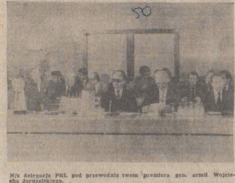
N/z delegacja PRL pod przewodnictwem premiera gen. armii Wojciecha Jaruzelskiego.