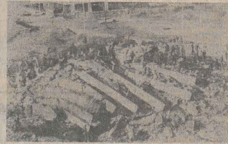
N/z: Zgłiszczą budynków zajmowanych przez żołnierzy francuskich wchodzących w skład międzynarodowych sił pokojowych.

O 6 rano w niedzielę olbrzymi wybuch wstrząsnął Bejrutem. Minutę później kolejna równie silna eksplozja rozległa się echem po całym mieście. W dwóch najwyraźniej zsynchronizowanych atakach została doszczętnie zniszczona kwatery główna amerykańskiej fletchoty morskiej, znajdująca się w trzypiętrowym budynku, przy międzynarodowym lotnisku w Bejrucie. Siedziba francuskiego kontyngentu, mieszcząca się bliżej centrum miasta, w ośmiopiętrowym gmachu, została zmieciona z powierzchni ziemi.