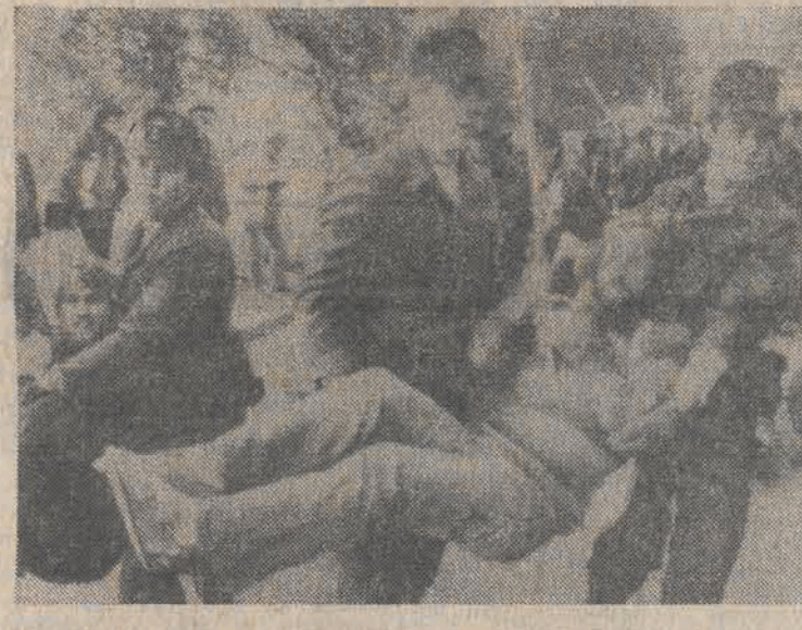
RFN. Policja rozprzeczła uczestników demonstracji pokojowej zorganizowanej 22 bm. w Stuttgarcie.

W sobotę i niedzielę w całej Europie zachodniej odbywały się podobne wielkie demonstracje w obronie pokoju. Wzięło w nich udział ponad 2 miliony ludzi - członków i sympatyków najróżniejszych organizacji społecznych, związków zawodowych, partii politycznych i wspólnot wyznaniowych.