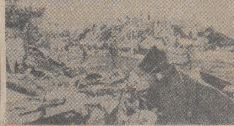
Liban. Doszczętnie zniszczona przez eksplozję 23 bm. kwatery główne amerykańskiej piechoty morskiej znajdująca się przy lotnisku w Bejrucie.