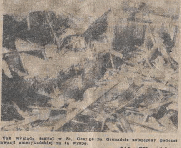
Tak wygląda szpital w St. George na Grenadzie zniszczony podczas inwazji amerykańskiej na tę wyspę.