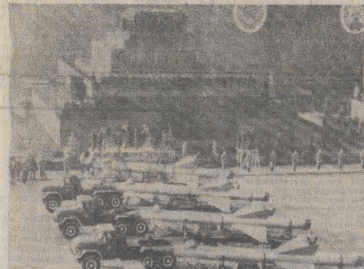
N/z: uroczysta defilada przed Mauzoleum Lenina na Placu Czerwonym.

Do Iraku udaje się ekipa polskich specjalistów, którzy kierować będą cementownią. Do obowiązków „Budimexu” należy zapewnienie produkcji pełnego asortymentu cementu konserwacja urządzeń, nadzór nad prawidłową eksploatacją złóż surowcowych oraz nad jakością stosowanych surowców i produktu finalnego. Kontrakt przewiduje także szkolenie miejscowego personelu, tak, aby po ok. 2 latach prowadzenie cementowni przejęli Iracyjczycy. Chodzi tu zatem o eksport naszych umiejętności i doświadczeń czyli o rzadki i cenniejszy w naszym handlu zagranicznym sposób zarabiania dewiz. (PAP)