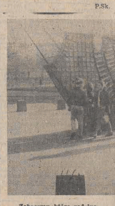
Zobaczmy, która godzina...