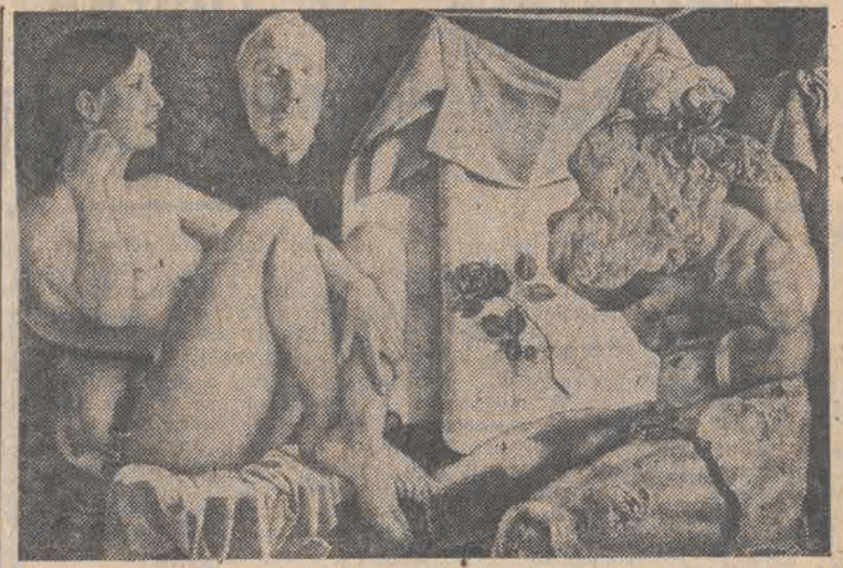
„Dziewczyna z różą” W. Garbolińskiego.

zawionione bezpośrednio przez nauczyciela, bądź pośrednio, za sprawą niektórych uczniów, których grono pedagogiczne nie jest w stanie ockiełznać. Mielłmy już w szkołach tzw. gitowców, mamy narkomanów i innych nie przystosowanych społecznie, którzy swoim postępowaniem dają innym żyć, zaraźliwy przykład. Bywa często, że nauczyciele „nie zauważają” owych problemów, dopuszczając do rozpręstrzenia się zła, czego liczne przykłady są znane z kronik młodych. W wielu przypadkach bezsporna wydaje się wina nauczycieli polegająca na zaniedbaniu odpowiednich działań profilaktycznych. Wydaje się jednak również, że skoro ustawa „O postępowaniu w sprawach nieletnich” dopuszcza możliwość pociągnięcia do odpowiedzialności karnej rodziców zaniedbujących się w swych obowiązkach wychowawczych, to również określone sankcje mogą znaleźć zastosowanie wobec wszystkich innych odpowiedzialnych za wychowanie powierzonych ich opiece dzieci i młodzieży, także pracowników szkoły.