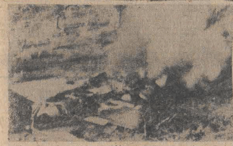
Liban. Szczątki samolotu izraelskiego zestrzelonego w górach Szuf.

DZISIEJSZE WYDANIE „GŁOSU ROBOTNICZEGO” PRZYNOŚI OBSZERNE FRAGMENTY PRZEMÓWIENIA KOŃCOWEGO GEN. W. JARUZELSKIEGO NA XIV PLENUM KC PZPR