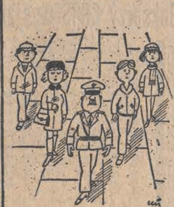
Shef eskadry lotniczej na przedchadze!