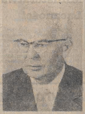
GUSTAV HUSAK, sekretarz generalny Komitetu Centralnego Komunistycznej Partii Czechosłowackiej Republiki Socjalistycznej.