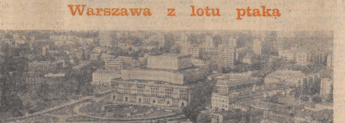
N/z.: Okazuje prezentuje się z góry gmach Teatru Wielkiego i jego okolice.

a rodziny, które całymi latami czekają w kolejce do adopcji. Tymczasem w państwowych domach dziecka orzeczywiał w 1982 roku 15 tysięcy sierot. Liczba ta zmniejsza się ostatnio z roku na rok ze względu na to, że wielu wychowanków umieszcza się w rodzinach zastępczych. Ale zjawisko sieroctwa społecznego nie maleje i wciąż tysiące dzieci czekają na opiekę, choćby przybranych rodziców. Kolejka wciąż rośnie. Dość powiedzieć, że w „ogonku” po dziecko „stoi się” około trzech lat. Efektom istnienia tych dwóch pozornie uzupełniających się potrzeb jest jednak nie wzrost, ale spadek liczby adopcji. W 1975 r. za pośrednictwem ośrodków adopcyjno-opiekuńczych TPD