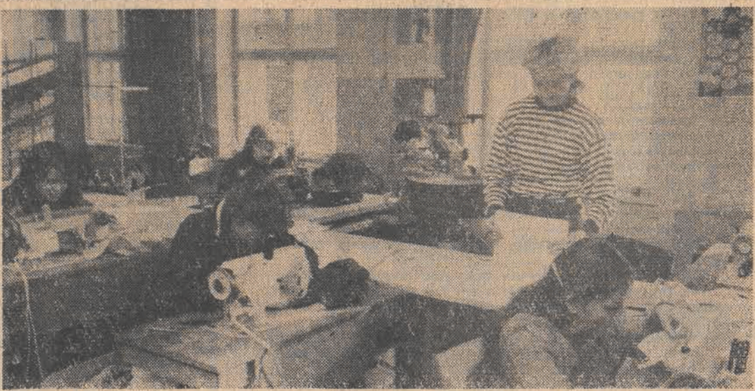
„Nad wzornictwem czuwa dział przygotowania produkcji, mózg całego przedsiębiorstwa. Tu powstają między innymi koncepcje i projekty nowości.”

Do tej grupy należy emeryci. Znaczący — zasłużony. Jak tłumaczy się z łaciny.