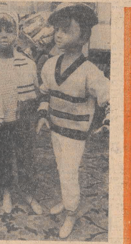
„Chałupnictwo może i potrafi robić produkcję inną niż pozostałe sektory”.

z zagranicy są setki. W zasadzie się je odrzuca. Dość często jednak zdarza się, że cudzoziemiec decyduje się zaopiekować dzieckiem ułomnym. Jest to zwykle równoznaczne z możliwością zapewnienia specjalistycznego leczenia. Wówczas decyzje bywają pozytywne. Podobny kłopot mają ośrodki TPD ze starszymi dziećmi. Wśród stu adoptowanych dzieci tylko dwoje, troje ma więcej niż pięć lat. Adopcja kilkulatka to trudne i niepewne przedsięwzięcie. Zdarza się, że nie tylko „rodzice” rozmyślają się, rozczarowani nie tak jak trzeba ukształtowaną osobowością dziecka; również ono może odrzucić nowych rodziców. Dlatego TPD dąży do prawnego usankcjonowania typu rodziny preadaptacyjnej, zakładanej na pewien czas, na próbę. Jeśli dziecko i