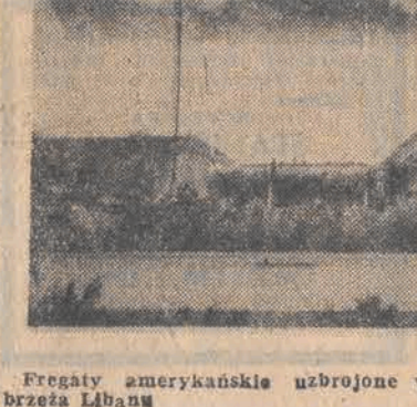
Fregaty amerykańskie uzbrojone w rakiety nuklearne patrolują wybrzeża Libanu

funkcjonariusze MO, którzy strzegą ociałych mieszkań. Pracownicy Zakładu Gazownictwa — Łódź kontynuują kontrolę szczelności sieci gazowej w okolicy bloku nr 214. Zaplanowano do mieszkańców — aby urządzenia odbiorcze do czasu zakończenia tych działań pozostały wyłączone. Uczestniczą w tych pracach również brigady Okręgowych Zakładów Gazownictwa z Warszawy. W najbliższych dniach ogrodzenie zostało już tylko ekipy dyżurne oraz