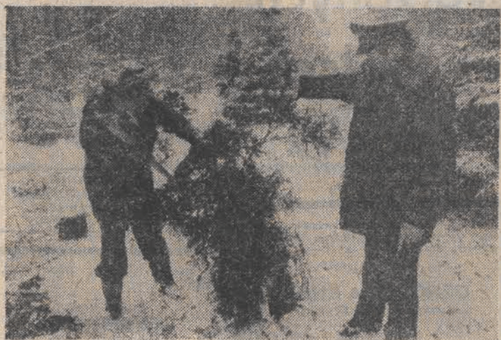
N/z: na plantacji w lesnictwie Gasiory rozpoczął się wyrab cholek.

Komisja Pracy i Spraw Socjalnych uchwaliła wniosek w sprawie wniesienia do budżetu poprawki dotyczącej zapewnienia środków na wydatki w przyszłym roku trzeciej raty rewolucyjnej emerytur i rent oraz na niezbędna z uwagi na wzrost kosztów utrzymania podwyżkę najniższych emerytur i rent. Uznano też za konieczne uwzględnienie w budżecie państwa środków na trzeci etap reformy zasiłków rodzinnych który ma być wprowadzony w związku z podwyżką cen żywności.