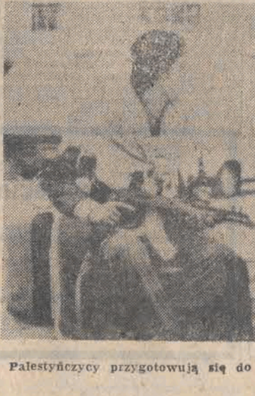
Palestyńczycy przygotowują się do ewakuacji z Tripoli.

Jak wynika z informacji „Deutscher Ostdienst”, organu centralnego organizacji rewizjonistycznych w RFN, przewodniczący episkopatu zachodniemieckiego, kardynał Josef Höffner przyjął „Stąd” Radę Ziomkostw Wschodniemieckich” pod przewodnictwem Herberta Hupki. Już samo to spotkanie jest gestem szczególnym wobec rewizjonistów, ponieważ zwyczaj takich spotkań w zasadzie - bcy był dotyczących zachodniemieckiej hierarchii kościelnej, utrzymującej dotąd nie wiążącą strukturę rewizjonistyczną w Kościele katolickim. „Omawiano z całą otwartością” - pisze „Deutscher Ostdienst” - wszystkie nurtujące niemieckich wędrownych sprawy”. Uczestnicy spotkania podziękowali kardynałowi „serdecznie zarówno za to rozmowę, jak i za jego liczne deklaracje na rzecz ożywczy i praw człowieka narodu niemieckiego”.