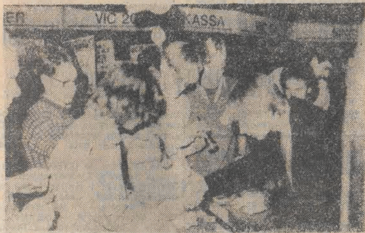
27 bm. w Szwecji nastąpiła awaria sieci energetycznej. Cała południowa i środkowa część kraju pozbawiona została światła, komunikacji kolejowej i miejskiej. N/z: wypłacanie pieniędzy w banku przy świetle latarek.