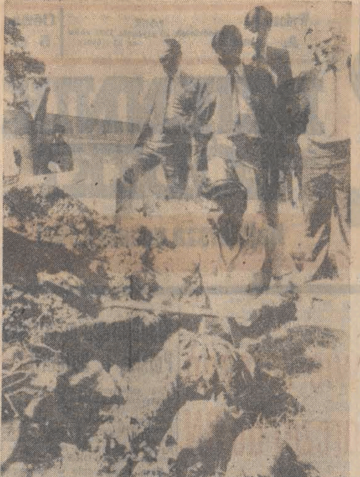
Na przedmieściach Buenos Aires odkopano wiele nie zidentyfikowanych zwłok. Ekshumacji dokonano na zlecenie sądu w związku z dochodzeniem w sprawie tysięcy zaginionych w latach siedemdziesiątych.