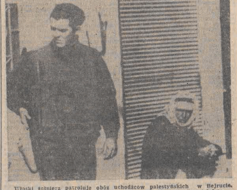
Włoski żołnierz patroluje obóz uchodźców palestyńskich w Bejrucie.

Prezydent Tunezji Habib Burgiba spotkał się w sobotę w Tunisie z przywódcą OWP, Jaserem Arafatem. Tematem ich rozmowy była sytuacja Palestyńczyków oraz światła arabskiego w przeddzień szczytu państw islamskich, który rozpoczyna się w poniedziałek w Casablance.