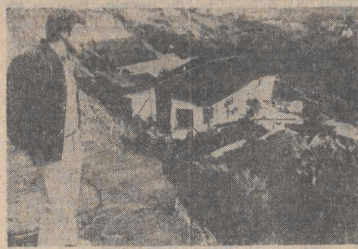
W San Clemente w Kalifornii osunęło się do morza kilka domów położonych na skarpie. N.z.: właściciel jednego z domów ogląda szczątki budynku, z którego zdołał uciec wraz z rodziną.

Ulewne deszcze i huraganowe wiatry nawiedziły obszarne rejony Europy północnej. Kłaska żywioła wa dotknęła szczególnie Wyspy Brytyjskie, Skandynawie, RFN, Irlandie i Danie. W W. Brytanii kaprysy pogody pociągnęły za sobą śmierć 8 osób. Ulewne deszcze i wichury spowodowały powódź w szkim ośrodku przemysłowym kraju, Glasgow. Trzy osoby zginęły, a co najmniej osiem odniosło obrażenia wskutek nieszczęśliwych wypadków, także spowodowały w RFN szalejące tam wichury. Jak podała zachodniopółnocna policja, wskutek gwałtownie przetrwanego wiatru w wielu autostradach. Silny wiatr i ulewne deszcze na wleźły w ciągu ubiegłej doby również Półwysp Jutlandzki. Spowodowało to powódzie w północnej Danii, gdzie poziom wody podniósł się o 2,5 metra. W wielu rejonach szybkość wiatru sięgała 140 km na godzinę. Huragan zrywał dachy domów, przewracał drzewa. W niektórych okęgach zerwała się sieć elektryczna. Przerwano komunikację lotniczą i promową. Jeden człowiek zabity, dziesiątki rannych - to bilans huraganu, który nawiedził 13 bm. Szwecje. Wiatry z szybkością 40 m na sek. poważnie uszkodziły podstacje elektryczne. Na północy kraju ponad 30 tys. domów pozbawionych zostało energii elektrycznej.