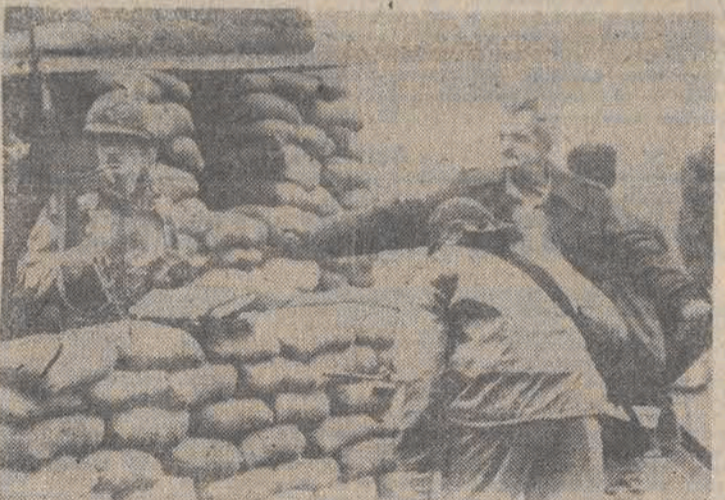
Żołnierze amerykańscy sprawdzają przechodniów przed ambasadą amerykańską w Bejrucie.