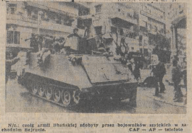
N/z: czołg armii libańskiej zdobyty przez bojowników szyickich w zachodnim Bejrucie.

Również w środę w Bejrucie i okolicach były areną walki między armią rządową a patriotycznymi siłami opozycyjnymi. Do walk po stronie armii ponownie włączyły się okręty amerykańskie, ostrzelując pozycje zajmowane przez jednostki druzyjskie. Jednocześnie rozpoczęła się ewakuacja żołnierzy amerykańskich.