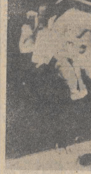
Tak wygląda spacer kosmiczny amerykańskiego kosmonauty Brucea McCandlessa na zewnątrz wahadłowca „Challenger”. Jest to pierwszy spacer bez połączenia z macierzystym statkiem kosmicznym.

Przedstawiciel „Lloyda” zapowiedział, że stawka ubezpieczeniowa przy następnym podróży „Challengera” zostanie „znacznie podniesiona”. Tymczasem astronauta amerykański