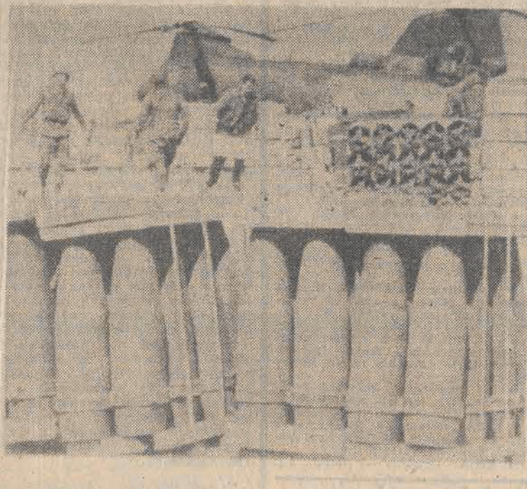
Amerkańscy „marines” przygotowują się do ewakuacji na pokład jednego z okrętów wojennych.