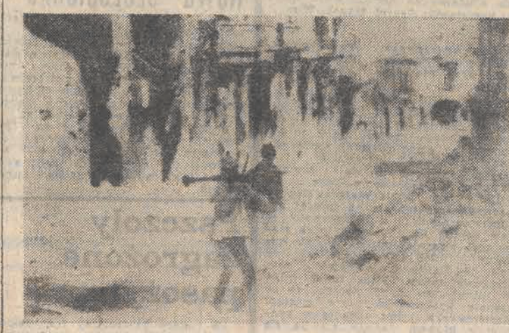
Zniszczone domy w starej handlowej dzielnicy.