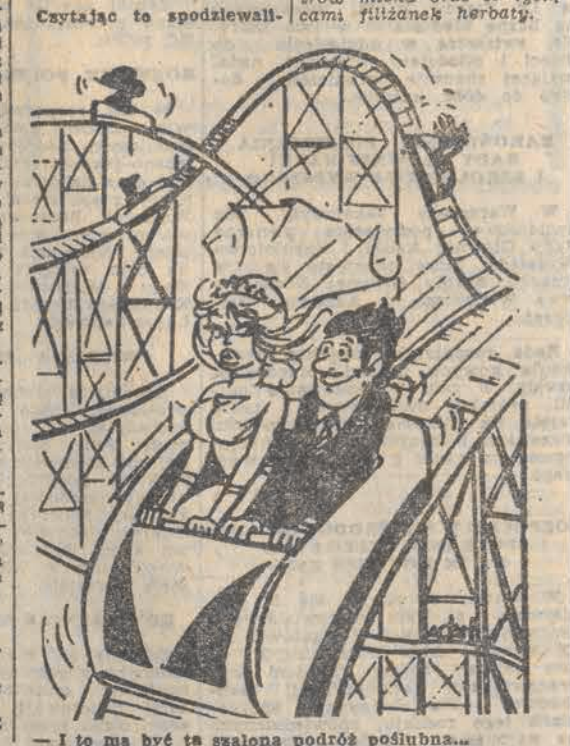
— I to ma być ta szalona podróż poślubna...

LANDRYNEK i rosnąca cena syropu, to po odpowiedniej obróbce można z tego wadu uzyskać około litra wysokiej jakości spirytusu. Podobno niektórzy docnie redaktor obliczyli, że Teneta z krakowskiego „Dziennika Polskiego” pisała, że wszystkiemu winna jest kalkulacja, bo wbrew w podanej ilości kosztuje za litr 174 zł. Jest tego sporo: 3 krople, 17 kropli, 25 kropli, 420 kropli, 6,8 km kłobasy i 3,5 tony pieczywa. Popółka to 8 tysięcy litrów mleka oraz 93 tysiącami filiżanek herbaty.