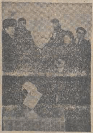
Na zdjęciu: głosię Konstantin Czernienko.

W niedzielę odejścił także na Bliski Wschód minister obrony Francji, Charles Hernu. Przeprowadził on dwudniowe rozmowy z władzami Kuwejtu i Arabii Saudyjskiej na temat problemów Bliskiego Wschodu, przede wszystkim uwzględniając sytuację w Libanie. Przedmiotem dyskusji będą także kwestie współpracy wojskowej między Paryżem, Rijadem i Kuwejtem.