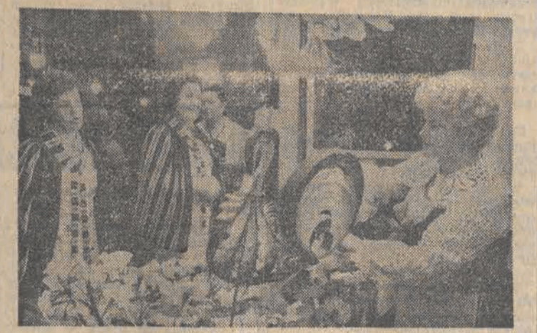
3 marca w warszawskim Domu Chiopa odbył się karnawałowy bal, na którym gościł czytelnicy popularnego tygodnika „Przeglądka”. Dochód z balu przeznaczono na budowę Centrum Zdrowia „Maki” Polki. Na zdjęciu: kotyliony na bal przygotowały gospodynie miasta i gminy Koziegłowy.

4 marca, w dniu wyborów lokalnych wyborcze w całym Związku Radzieckim otwarte były od godziny 6.00 rano do 22.00. Od pierwszych godzin głosowania frekwencja wyborcza była bardzo wy-