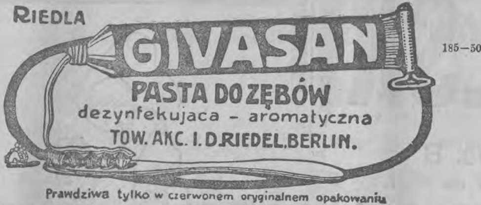
Prawdziwa tylko w czerwonym oryginalnym opakowaniu