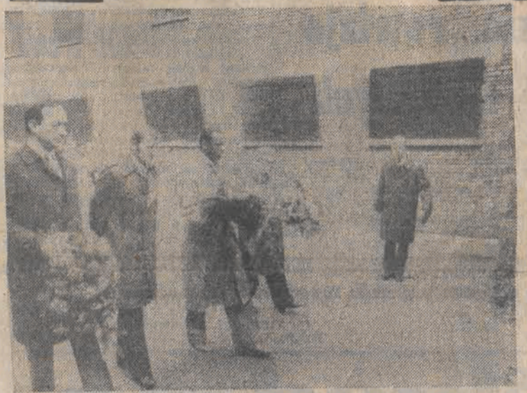
Moment składania wieńca pod ścianą śmierci w obozie w Oświęcimiu.

WTOREK 10 BM. BYŁ DRUGIM DNIEM OFICJALNEJ WIZYTY PRZYJAŹNI JAKĄ NA ZAPROSIENIE I SEKRETARZA KC PZPR, PREZESA RADY MINISTRÓW GEN. ARMII WOJCIECHA JARUZELSKIEGO SKŁADA W POLSCE DELEGACJA PARTYJNO-PAŃSTWOWA ANGOLSKIEJ REPUBLIKI LUDOWEJ POD KIEROWNICTWEM PRZEWODNICZĄCEGO LUDOWEGO RUCHU WYZWOLENIA ANGOLI — PARTII PRACY, PREZYDENTA ANGOLSKIEJ REPUBLIKI LUDOWEJ JOSE EDUARDO DOS SANTOSA TEGO DNIA ANGOLSCY GOŚCIE UDALI SIĘ NA POŁUDNIE NASZEGO KRAJU — DO OŚWIECENIA I KRAKOWA.