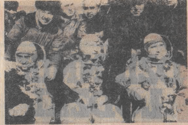
Międzynarodowa załoga statku kosmicznego „Sojuz — 10” po wylądowaniu 11 bm. w rejonie miasta Arkalyk.

Japoński projektant mody Yuroi Kaitusa zaprezentował w Warszawie szereg sukien — szablona szablona i perłami suknie szablona o wartości 300 mln jenów (138 mln dol.). Prace przy nowym modelu, odciebiom 83 diamantami i 25 tpy pereł trwały 5 miesięcy.