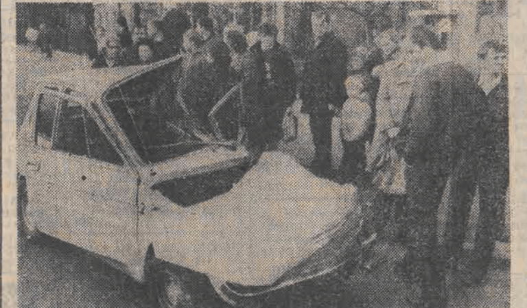
Skutki nieostrożnej jazdy.

Wydział Finansowy Urzędu Miasta Łodzi informuje, że wpłaty odpisów amortyzacyjnych od przedsiębiorstw z terenu województwa łódzkiego