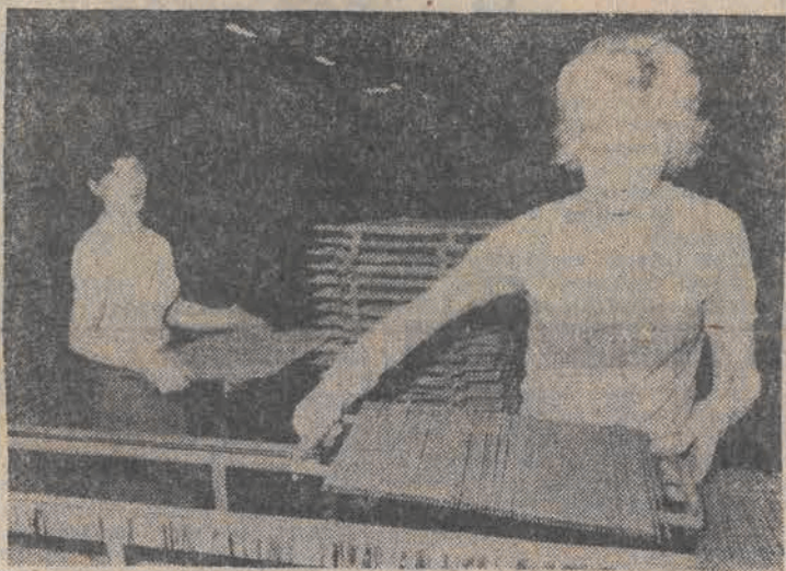
Członkowie ZSMP w Hucie „Balidon” w Katowicach wykonali swoje zobowiązania podjęte dla uczczenia 40-lecia PRL. Pracując w wolnej sile wyprodukowali 39 ton elektrod spawalniczych, wartość tej produkcji wyniosła ponad 1.300 tysięcy złotych. N/a: przy linii produkcyjnej elektrod.