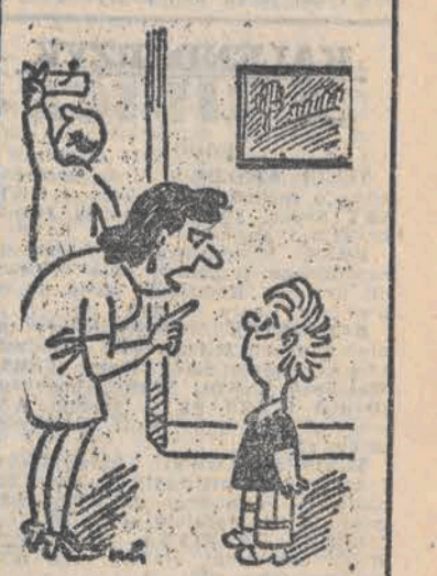
— Kochanie, kiedy ojciec wraca do domu, nie mów stale „to tylko tatuś”, nawet jeśli to jest tylko tatuś!...