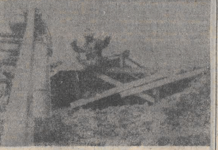
8 bm. centralne i południowe rejony Włoch nawiedzone zostały przez trzęsienie ziemi. 6 tys. ludzi zostało bez dachu nad głową, zginęły 3 osoby, a ok. 100 odniosło rany. Na zdjęciu: zniszczenie w miejscowości Pescara.

jął 9 miejsce, a Paweł Bartkowiak był 10. Drużynowo zwyciężyła oczywiście reprezentacja NRD. Aż czterech zawodników tego zespołu znalazło się w czołowej 10. Kolarze NRD wyprzedzili ZSRR i Polskę, a 4 miejsce przypadło dzięki znakomitej jeździe Stajkowi, drużynie Rukzari. Olaf Ludwig po wspaniałej jeździe wywalczył nie tylko zwycięstwo etapowe, ale objął także przewodnictwo w klasyfikacji indywidualnej wyprzedzając swego rodaka Uwe Raaba (Dalszy ciąg na str. 2)