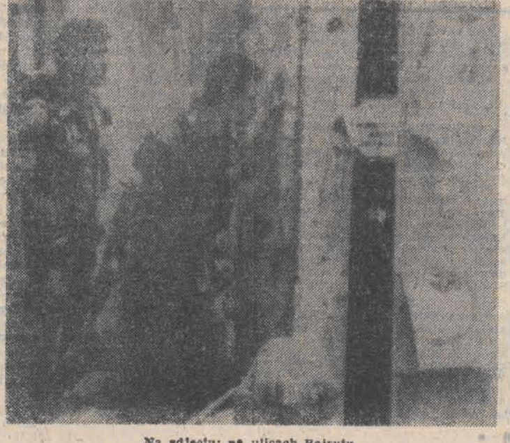
Na zdjęciu: na ulicach Bejrutu

Brazylijska sieć telewizyjna „O Globo” podała w czwartek, że w Feira de Santana, w stanie Bahia wybuchła epidemia nieznanego choroby wirusowej. W ciągu ostatnich 15 dni zmarło co najmniej 134 dzieci od roku do 8 lat. W czasie choroby następuje odwodnienie organizmu. Władze stanu Bahia położonego w północno-wschodniej części Brazylii, badała przyczynę epidemii. W leczącym ok. 200 tysięcy mieszkańców mieście Feira de Santana nieznaną wirus wywołał panikę.