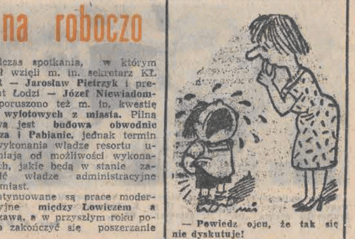
— Powiedz ojen, że tak się nie dyskutuje! (Dalszy ciąg na str. 3)