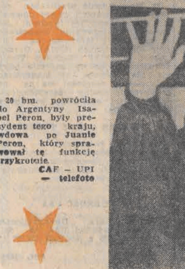
20 bm. powróciła do Argentyny Isabella Peron, były prezydent tego kraju, wdowa po Juanie Peronie, który sprawował tę funkcję trykrotnie.