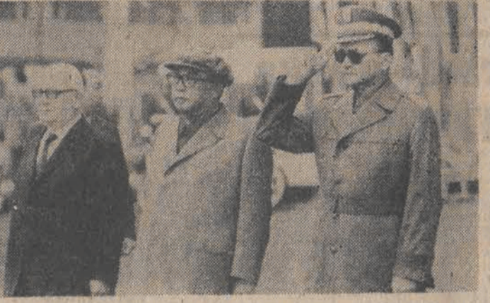
Nz.: gen. armii Wojciech Jaruzelski, Kim Ir Sen i Henryk Jablonski.

Dobiegła końca oficjalna wizyta przyjaźni, jaką na zaproszenie Komitetu Centralnego Polskiej Zjednoczonej Partii Robotniczej, Rady Państwa i Rady Ministrów Polskiej Rzeczypospolitej Ludowej złożyła w naszym kraju delegacja partyjno-państwowa Koreańskiej Republiki Ludowo-Demokratycznej pod przewodnictwem sekretarza generalnego Komitetu Centralnego Partii Pracy Korei, prezydenta Koreańskiej Republiki Ludowo-Demokratycznej Kim Ir Sena.