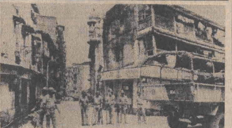
W wyniku trwających już od ponad tygodnia w Basmala starć między wyznawcami hinduizmu a muzułmanami zginęło co najmniej 215 osób. Do Bombaju i przylegających rejonów zostały wysłane dodatkowe oddziały wojskowe. Nz.: żołnierze na ulicach muzułmańskiej dzielnicy miasta.

zyjnego. Zabiegi te muszą być realizowane przed każdym sezonem zimowym, pod rygorem utraty gwarancji. Do świadczenia tych usług fabryka upoważniła na razie 52 autoryzowane stacje, które zapewniają prawidłowe wykonanie tej czynności. Wykaz tych placówek dołączony jest do książki gwarancyjnej. Oprócz tego nowy użytkownik samochodu z FSO otrzymuje instrukcję mówiącą o zasadach konserwacji nadwozia.