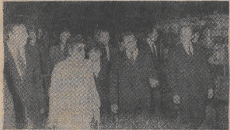
N/z: Podczas wizyty w FSO.