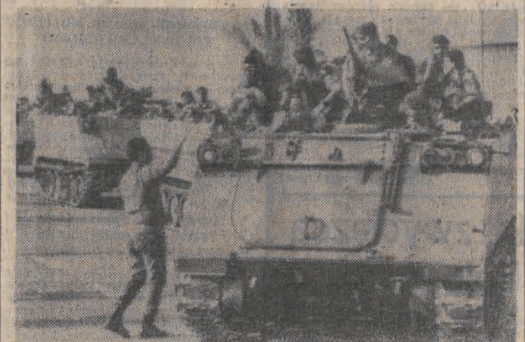
Jednostki Armii Libańskiej rozpoczęły przemieszczanie sił w obrębie wielkiego Bejrutu.

Bez porozumień politycznych a także bez poparcia i pomocy Syrii operacja ta nie byłaby możliwa do przeprowadzenia.