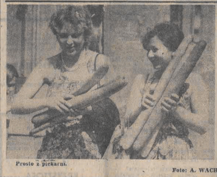
Prosto z piekarni.

Gazety, małe zabawki, proszek do prania przywrócić nam się kupować w kioskach w pobliżu naszego miejsca zamieszkania.