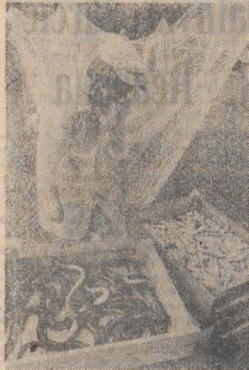
Rybak z Państwowego Gospodarstwa Rybackiego od czasu do czasu „urozmaica” mieszkańcom i turystom życie sprzedając nadwzrostki ziołonych węgorzy i śleziawy. Ceny są do „przyjęcia”, a więc chętnych nie brakuje.

Tym, którzy w najbliższym czasie nie planują odwiedzenia Ostródy, pozostaje tylko życzyć, aby tego typu atrakcje miały miejsce także w innych rejonach kraju.