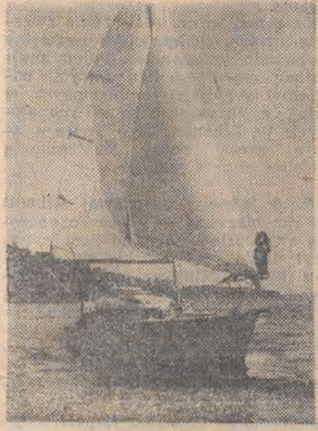
Odpoczynek pod żaglami.