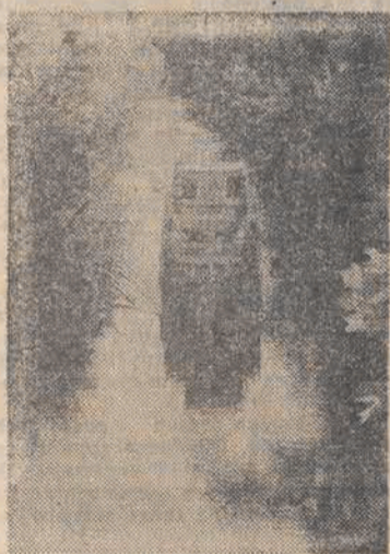
Podróż statkiem z Ostródy do Elbląga trwa ponad 8 godzin. Wiedzę przez łanuch Heznych jezior, położonych na różnych wysokościach przez dwie śluz i 5 tzw. pochylini. Na tej malowniczej trasie kursują statki Żegluga Mazurskiej w Giżycku.