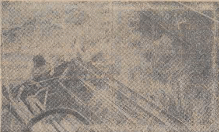
Żniwa w PGR Ptaszkowo (woj. poznańskie). Zboże kosi się 16 kombajnami na 2000 ha. Na zdjęciu: mechanicy z pogotowia technicznego wykonują naprawy na polu.

Trudne tegoroczne żniwa zbliżają się do półmetka. Z informacji, które napływają z województw do Ministerstwa Rolnictwa i Gospodarki Żywnościowej wynika, że w skali kraju skoszone do 15 bm. 47 proc. zbóż. W województwach wschodnich i centralnych, gdzie w sierpniu warunki atmosferyczne sprzyjały dotychczas żniwiarom, prace przy koszeniu zbóż wkroczyły w ostatnią fazę. Natomiast w gminach na terenach podgórskich żniwa w zasadzie dopiero się rozpoczęły.