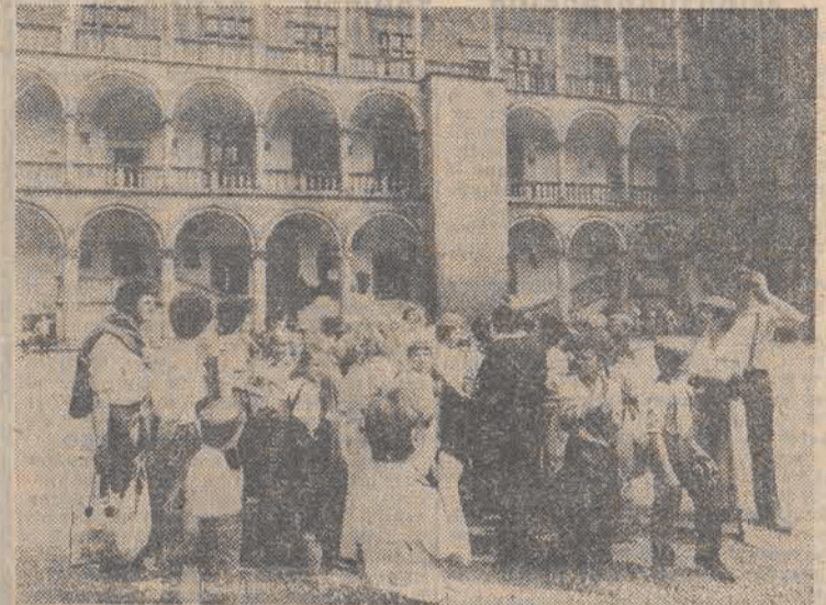
Kraków - to miasto odwiedzane przez turystów o każdej porze roku. Najwięcej ich jednak przetrzerza stare miłczki tego miasta i podziwia jego zabytki w okresie letnim. Wycieczki i goście indywidualni przyjeżdżają nie tylko z kraju, nie brakuje także przybyszów z zagranicy. Wszyscy bowiem, którzy odwiedzają nasz kraj, umieszczają w programie zwiedzania Krakowa. Na zdjęciu królewski Wawel - to cel wszystkich wycieczek odwiedzających - Kraków.

Utrzymana jest zasada, że cło jest podwyższane o 50 proc., jeśli sprowadzany z zagranicy samochód jest kolejnym autem sprowadzonym przez daną osobę lub członka jej rodziny prowadzącego wspólne gospodarstwo, zanim miną 3 lata od sprowadzenia poprzedniego. Nowością jest natomiast zasada mająca chronić przed sprowadzaniem samochodów o wątpliwym stanie technicznym. Polega ona na tym, że cło jest wyższe o 20 proc., jeśli samochód ma ponad 5 lat. Zatem, jeśli po 1 września br. ktoś przedstawi do oceny samochód wyprodukowany w 1979 r. lub wcześniej, zapłaci cło o 20 proc. wyższe od normalnego. Warto podać, że w wzb. osoby