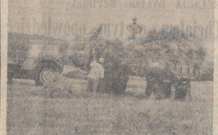
Wycorzystując sprzyjającą pogodę rolnicy żniwowali także w sobotę i niedzielę. N/z: pracownicy Nadleśnictwa Bierzwnik (woj. łódzkie)...